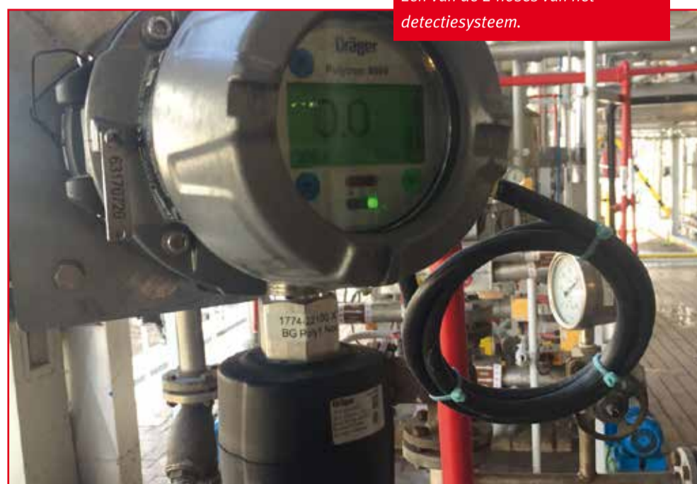
Eén van de E-noses van het detectiesysteem.